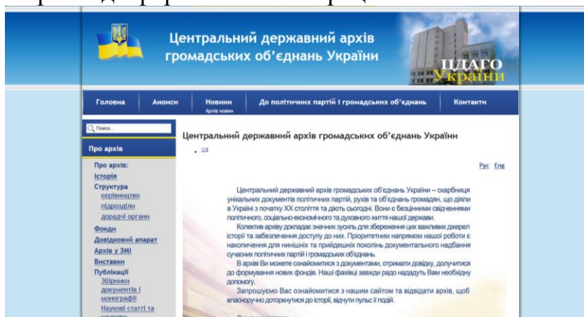
Рис. 2.2 Головна сторінка сайту Центрального державного архіву громадських об'єднань України